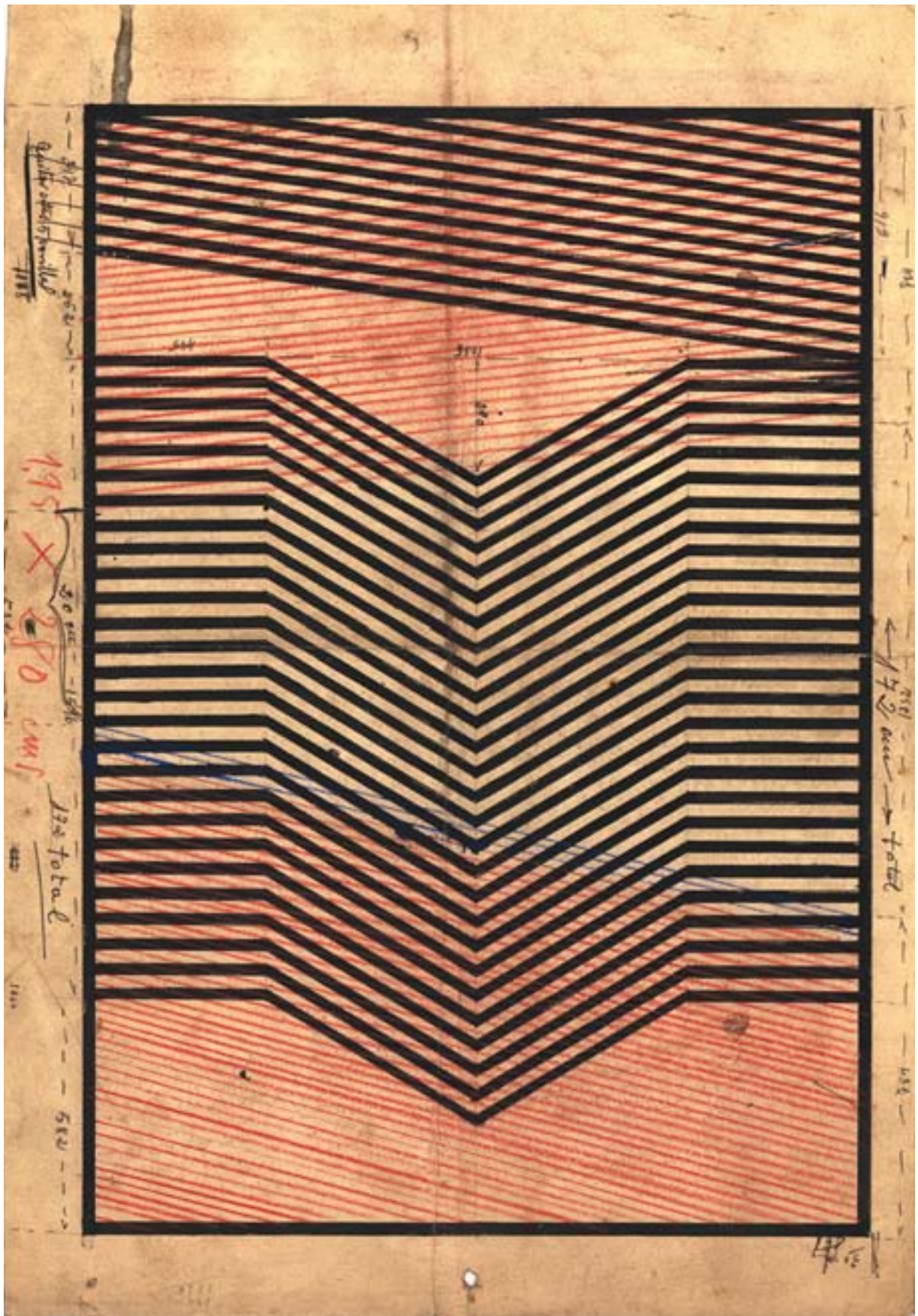
Boceto para Rejas, 1963, papel guarro, gouache negro, azul y lápiz rojo. 400 x 580 mm.